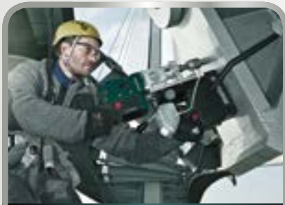
Puurimine ja kruvimine

Sealjuures keskendume järgmistele kasutusvaldkondadele: masinaehitus, laevatehased, tooraine-/energiatootmine vees (naftaplatvormid/ tuulepargid), rafineerimistehased, tuuleenergia, erimasinaehitus, torujuhtmete ehitus ja tuumaelektrijaamad.