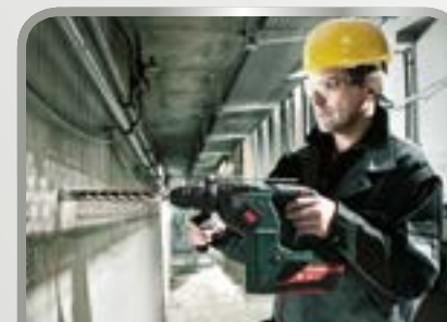
Puurimine ja kruvimine

Sealjuures on meie fookuses sellised kasutusvaldkonnad, nagu katus ja puutöö, aknaehitus, sein ja fassaad, siseehitus, siseviimistlus, põrandaehtitus, plaatimine ning aia- ja maastikukujundus.