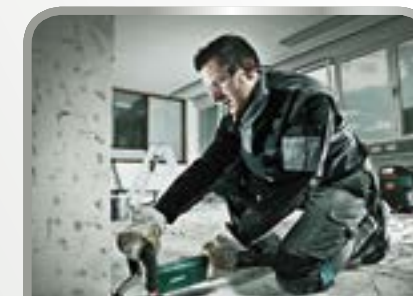
Lihvimine ja lõikamine