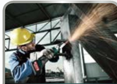
Lihvimine ja lõikamine